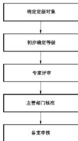
图 1 等级保护对象定级工作一般流程